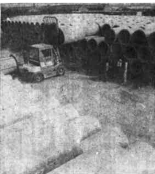
图为河口建筑建材公司一角。

步采用国际标准组织生产，自去年以来投资350万元，进行全面技术改造，从德国等地引进了咖啡桌生产线，生产的咖啡桌4月4日参加了美国产品展销会，深受外国客户青睐，日前已与美国雅丽客商洽谈成加工业务，产品将销往美国，为“河口货”走出国门迈出了可喜的一步。二是抓好成本管理，以价廉争市场。河口区的工业企业大都处在起步阶段，因此，降低产品价格，提高经济效益，重点是抓好成本管理。他们通过改进生产工艺、制订先进合理的物资消耗定额，采用新材料、代用品和开展物资综合利用等手段，提高能源、原材料的利用率。同时，他们还从原材料的选择、运输保管、生产加工等一系列工艺流程，一直到销售费用的各个环节，层层抓节约。如区市政工程公司在生产中狠抓成本管理，采用新材料，降低成本，还大力开展双增双节活动，使企业呈现出良好的生产运行机制。三是加强财务管理，提高资金利用率。全区各工业企业部门都按照《企业财务通则》和《企业会计准则》的要求，进一步完善了企业内部经济核算和经营责任制。在工作中，强化财务预算约束，严格财务制度和财务纪律，降低不合理费用，压缩不合理占用和开支，精打细算，堵塞漏洞，提高资金的使用效益。四是抓好营销管理，实现以销促产。克服过去存在的重生产轻销售和“酒香不怕巷子深”的老观念，吸取借鉴国内外成功的营销之道，在经营思想上，由过去的“生产——销售——用户”转为“用户——销售——生产”。如河口区建筑建材公司把传统的产推销售变为产前的市场导向，一切从用户的需要出发，以市场为依托组织生产，不断开拓生产的深度和广度，同时加强营销队伍建设，全面提高营销队伍素质，促进了企业发展，今年上半年完成产值155