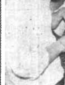
广饶县通过开展“管理效益年”活动，全县工业生产稳步增长，经济效益显著提高。今年上半年全县工业完成总产值132717万元，比去年同期增长33.8%；亏损面比去年同期下降29%。